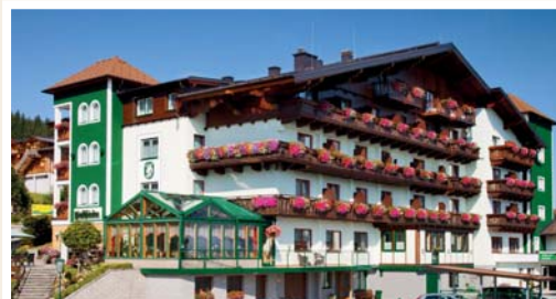
Alpenhotel Waldfrieden – Rohrmoos

Die Unterkunft für diese 5-Tagesfahrt ist das 4-Sterne Alpenhotel Waldfrieden in Rohrmoos.